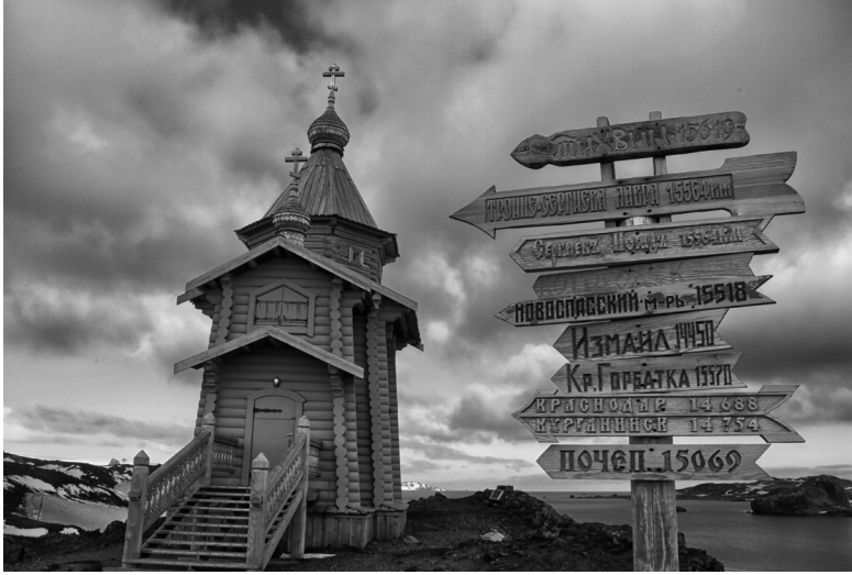
Iglesia ortodoxa de la Santísima Trinidad en la isla Rey Jorge.

Todo viaje entraña enigma, epifanía y encubre una revelación; un encriptado don divino que se vuelve amuleto. El mío estaba por manifestarse.