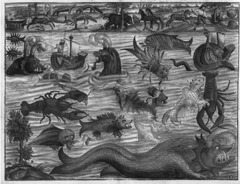
Placa Munster de monstruos de mar y tierra realizada por Ortelius (1550).

de clasificarse como razas plinianas o seudoplinianas . Cito: “Por un lado se dice que los hombres son regados por toda la Tierra y que tienen los pies al revés y que el zenit es parecido por todos, y que en toda parte nos dirigimos al centro de la Tierra”. Huelga decir que en las cartas náuticas el extremo sur es habitado por escilas, serpientes marinas y monstruos como islas que cobraban vida.