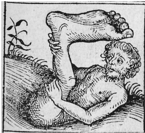
Detalle de un esciápodo o ser que hace sombrilla con sus pies, en el libro de Plinio el Viejo (año 79 d. C.).

En algunos momentos de las cartas náuticas, el vínculo ideológico de los territorios con lo animal y lo vegetal llegó a extremos delirantes, como el mapa del cartógrafo protestante alemán Heinrich Bünting de 1585, donde el mundo simula un trébol de tres hojas, o también el Leo Belgicus de 1611, que esboza la región de los Países Bajos con forma de león.